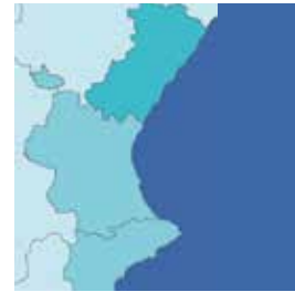
ÁMBITO DE ACTUACIÓN

Es socia de pleno derecho de las sociedades de servicios: Banco Cooperativo Español S.A., Rural Servicios Informáticos S.C., Rural Grupo Asegurador S.A. y Docalia S.L así como de las mercantiles Maestrat Gestió de Patrimoni SLU y Caixa Benicarló Operador de Banca Seguros SLU.