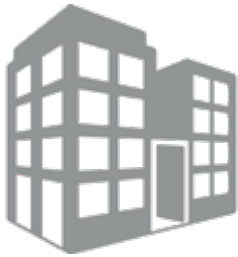
PERTENENCIA A SOCIEDADES

Pertenece al Fondo de Garantía de Depósitos de Entidades de Crédito, cuya garantía actual por depositante asciende a 100.000,00 euros.